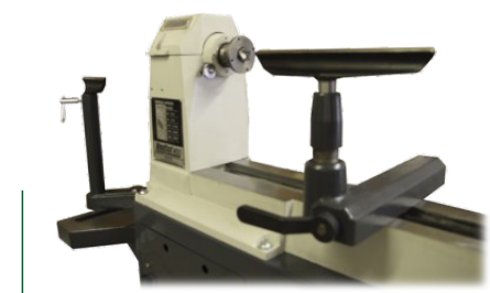
Handauflage m. Schnellverschluss