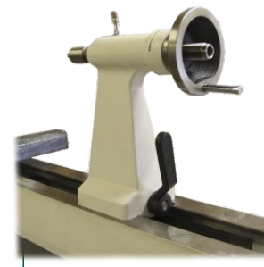
Reitstock mit Schnellverspannung