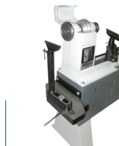
Außendrehvorrichtung als Option