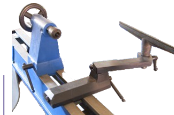
ausschwenkbare Handauflage für große Werkstücke