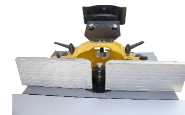
lange Frässpindel - Abdeckung klappbar